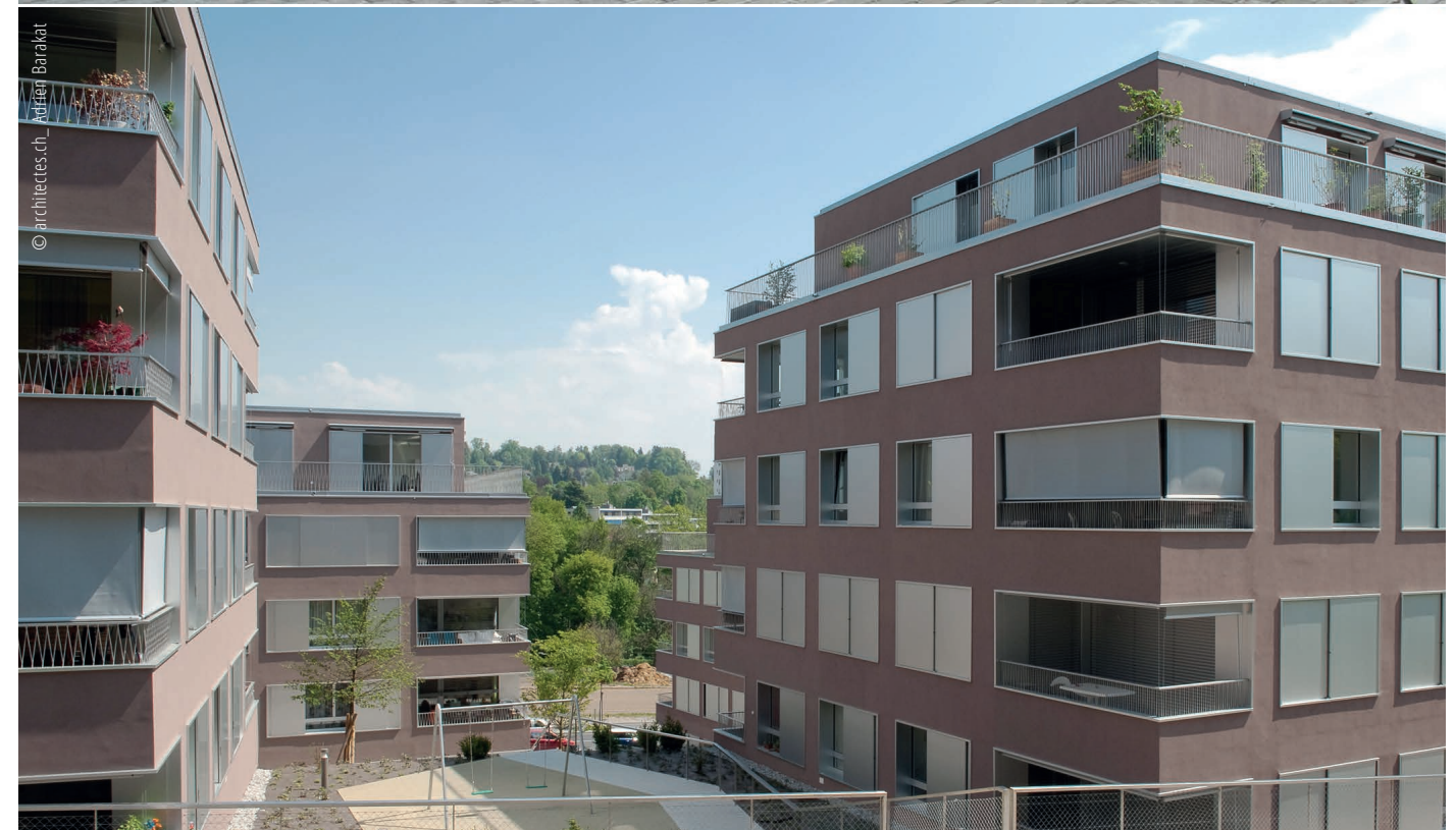
↑ Lausanne, Les Jardins de Prélaz. ↓ Lausanne, Victor-Ruffly.