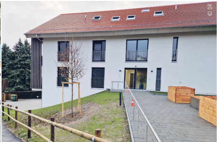
↑ Lausanne, Plaines-du-Loup. ↓ Gryon, Les Valérianes. ↘ Yens.