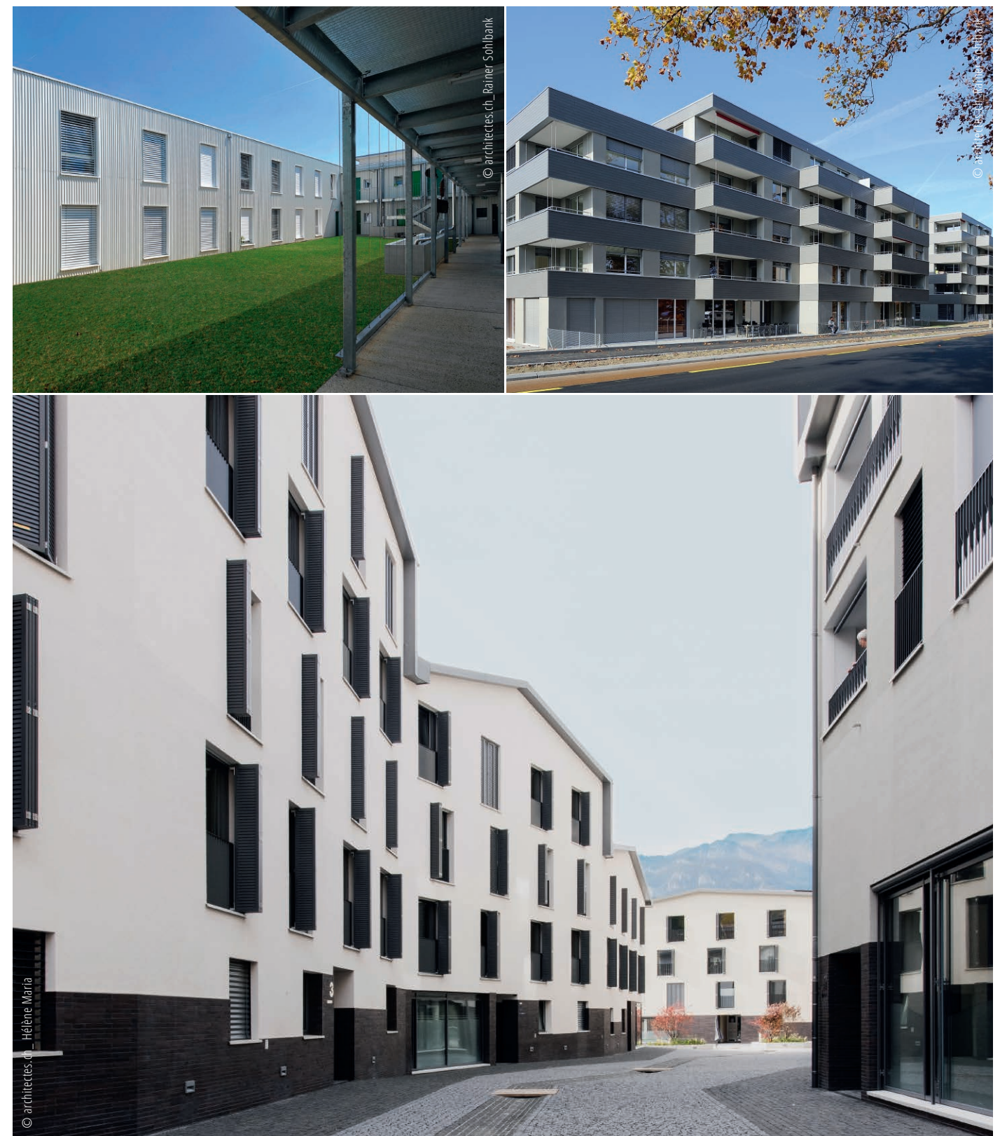
↑Lausanne, Le Patio. ↑Morges, Les Marinières. ↓Aigle, Clos du Bourg.

Au bénéfice d'une gouvernance composée de profils issus du savoir-faire, cette décennie est aussi celle des partenariats avec les communes vaudoises et la Fondation NetAge.