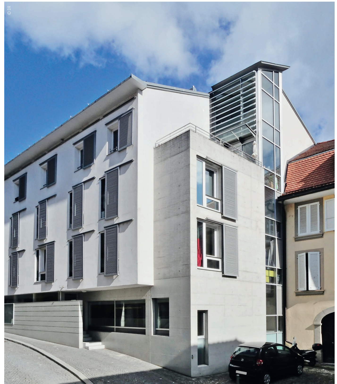
Lausanne, rue Cité-Derrière 18–28.